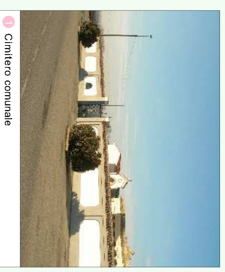
1 Cimitero comunale