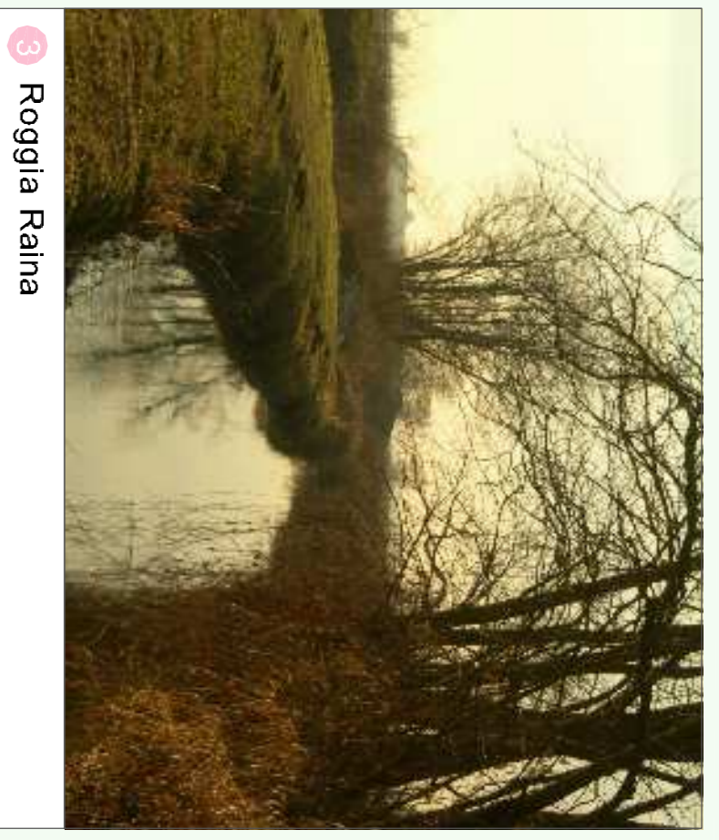
3 Roggia Raina